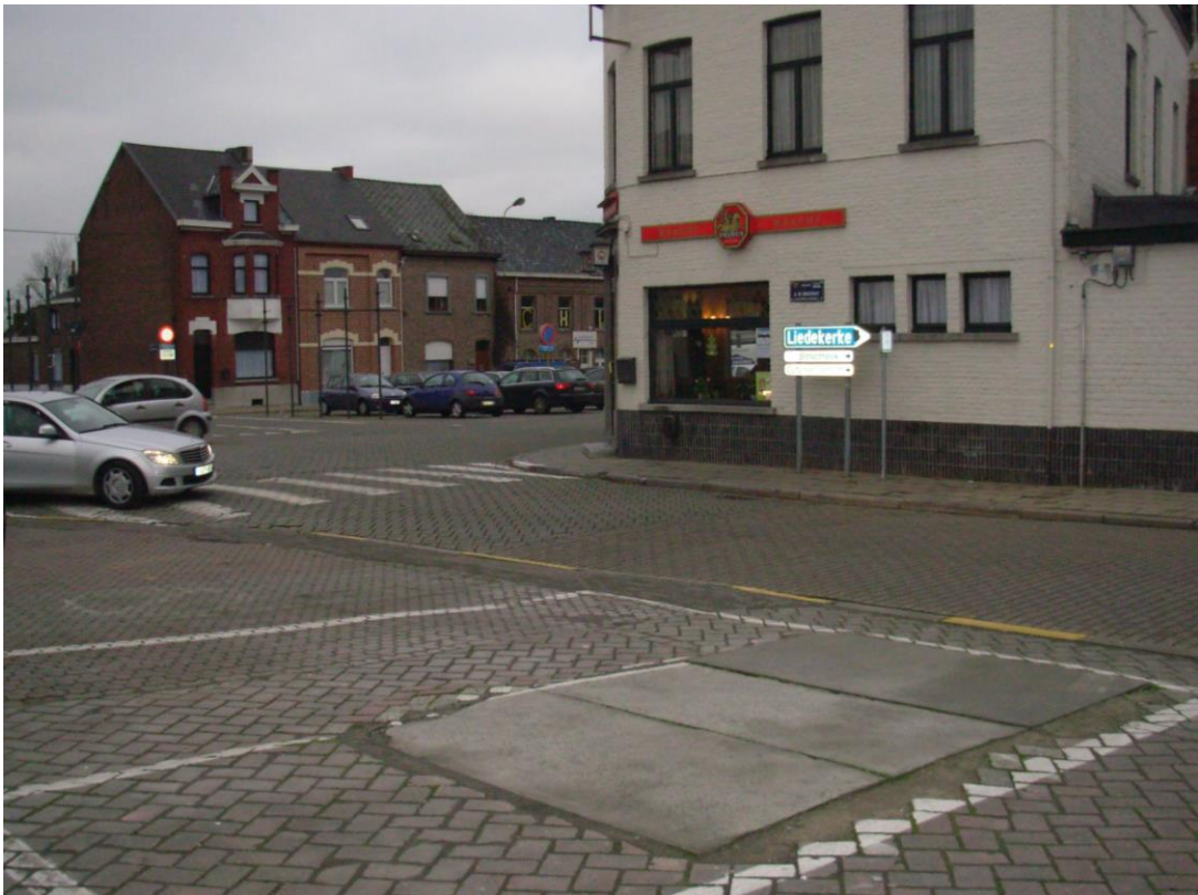
Op de voorgrond het met betonnen platen dichtliggende toegang

Daar is dit echter gebeurd na contact opnemen met de website www.bunkergordel.be wel al beslist, de structuur binnen de werken te integreren en verder te laten bestaan. Ook die structuur is zeker niet vlot toegankelijk (hij is zelfs volgens mij sinds 2011 niet meer open geweest en staat voortdurend zwaar onder water – zie foto)